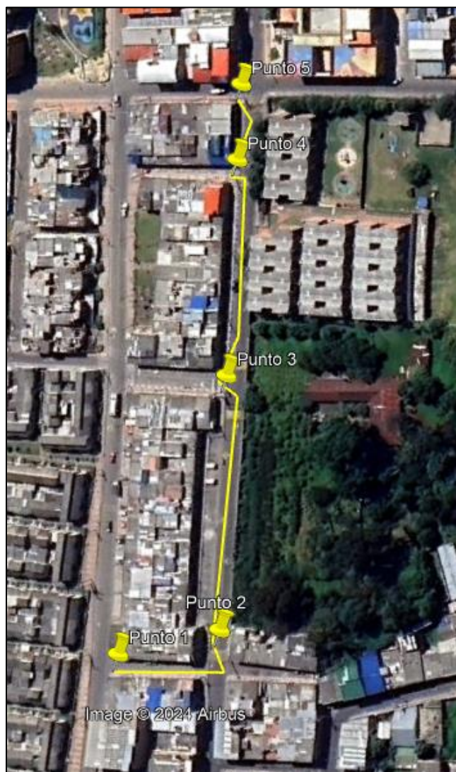
Ilustración 1. Recorrido verificación ambiental

Con base en lo anterior, el día 26 de agosto de 2024 se realizó recorrido de control y vigilancia en el barrio Renacer desde las coordenadas 4°42'35,004"N- 74°12'4,632"W hasta las coordenadas 4°42'28,02"N- 74°12'3,042"W (ver ilustración 1. Ruta amarilla).